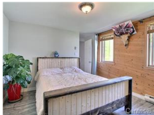
Chambre à coucher