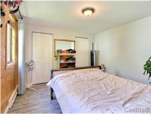
Chambre à coucher