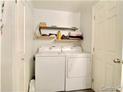
Salle de bains