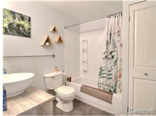
Salle de bains