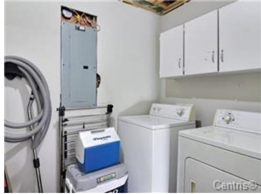
Salle de lavage