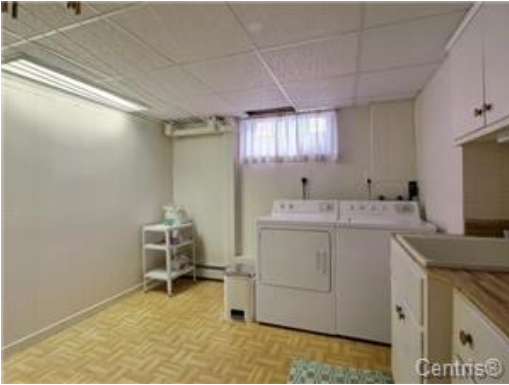
Salle de lavage